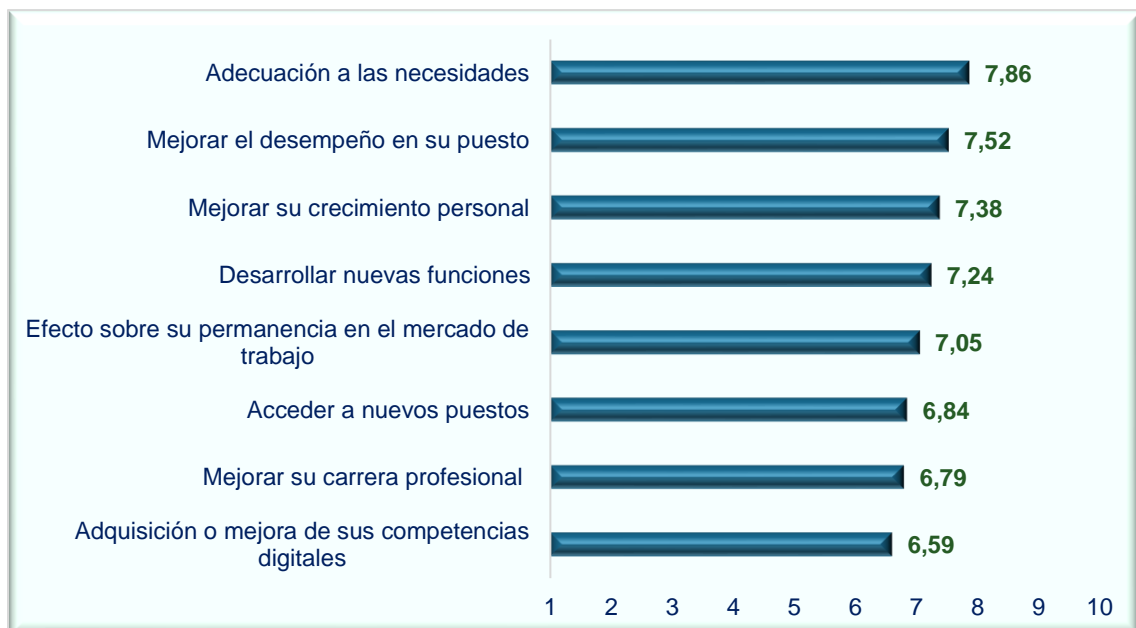
Gráfico 1/142 Valoración media de las personas trabajadoras sobre la formación recibida vinculada a la economía circular (escala de 1 a 10 siendo 1 en ninguna medida y 10 en mucha medida)

Fuente: Encuesta a trabajadores de empresas vinculadas a la economía circular Período de encuesta: 19 de abril al 17 de junio de 2024